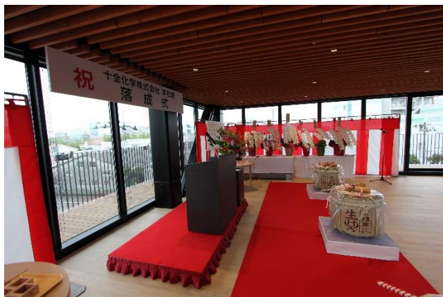
ありがとうございました！